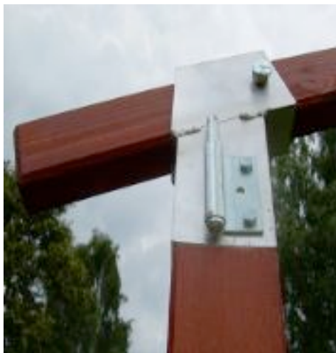
Sicherheits-Schrauben - & Lastpunkt für Beschwerungsmaterial

Planen immer trocken und trocken und luftig lagern!