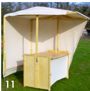
Bild 11 Rückenteil der Plane durch Lösen der Haltebänder herablassen. Sturmstützen St aufklappen, mittels Schraube sichern, rechts und links in untere Planenlatte (Rücken) einstecken, mit Druck nach unten spannen und oben in hintere Gabelscharniere einsetzen, Erdspieß ausfahren & feststellen.

Wichtig: Planen immer trocken und trocken & luftig lagern - im BW Planensack! Imprägnierte Stoffe können nicht gewaschen werden, s.a. FAQ - klipklap.de